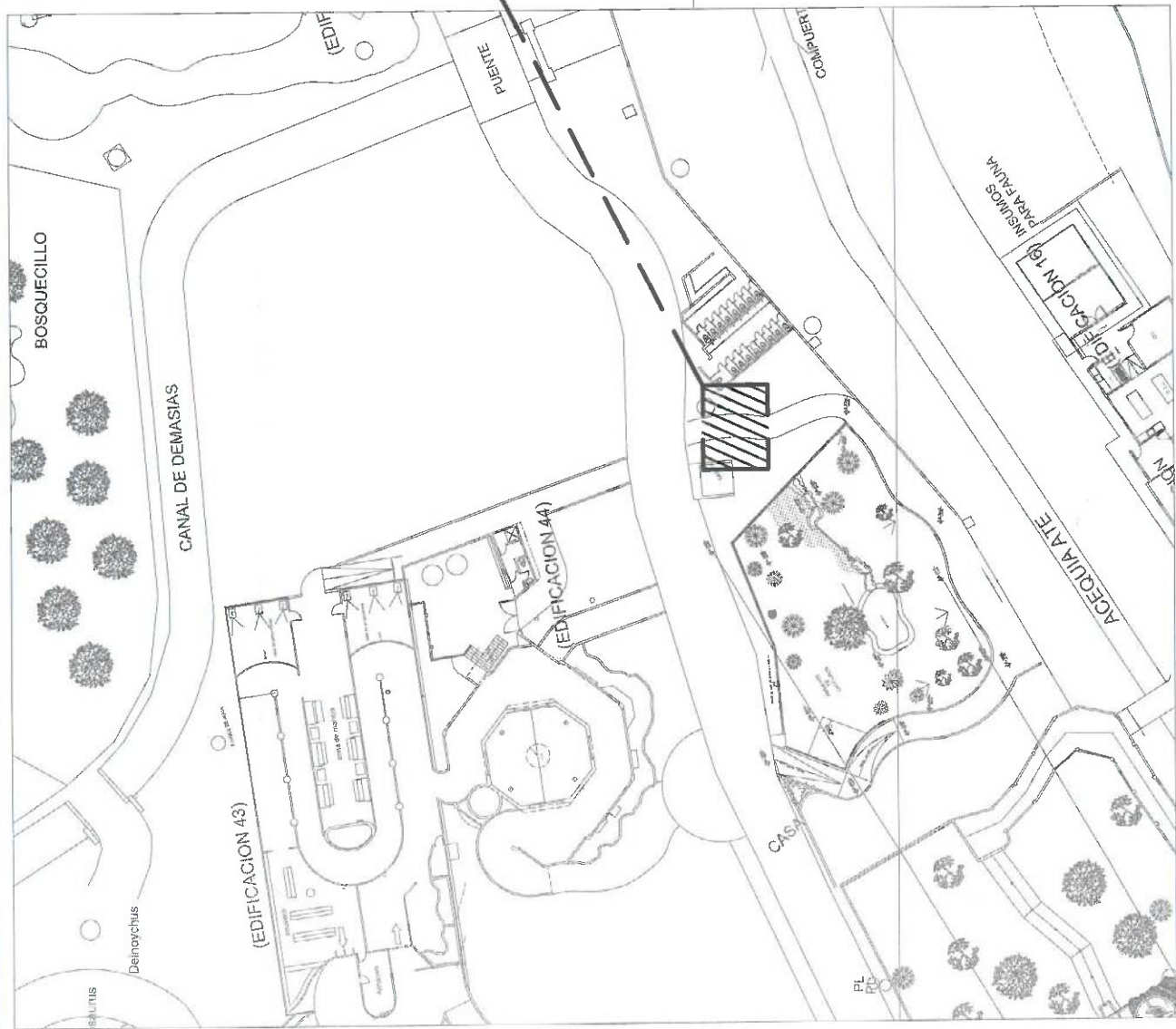
PLANO DE UBICACION