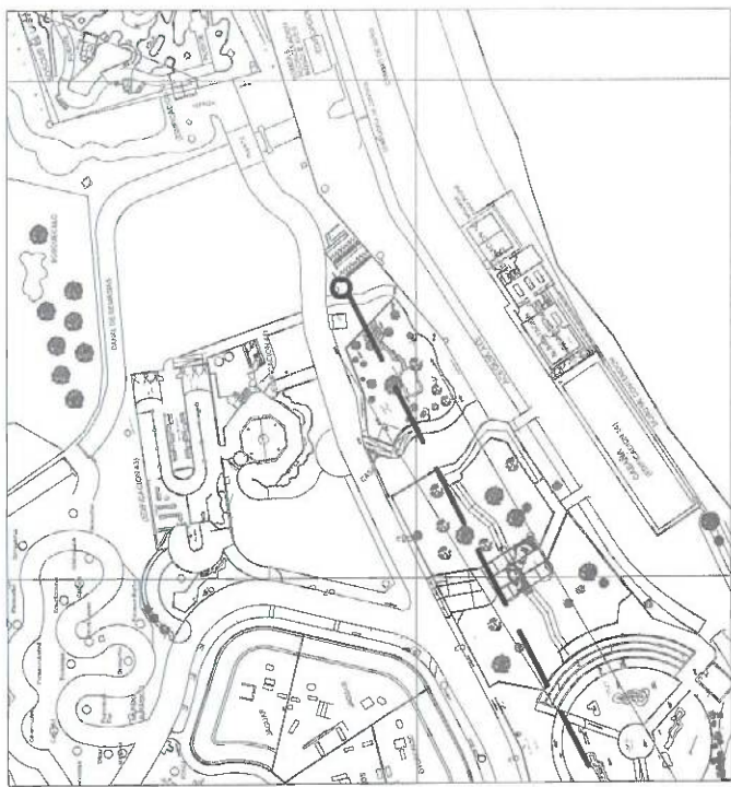
PLANO DE LOCALIZACION